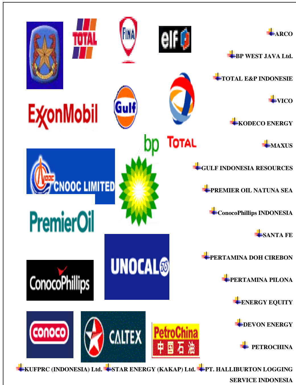
Gambar 1.2 Mitra Bisnis PT.Nesitor